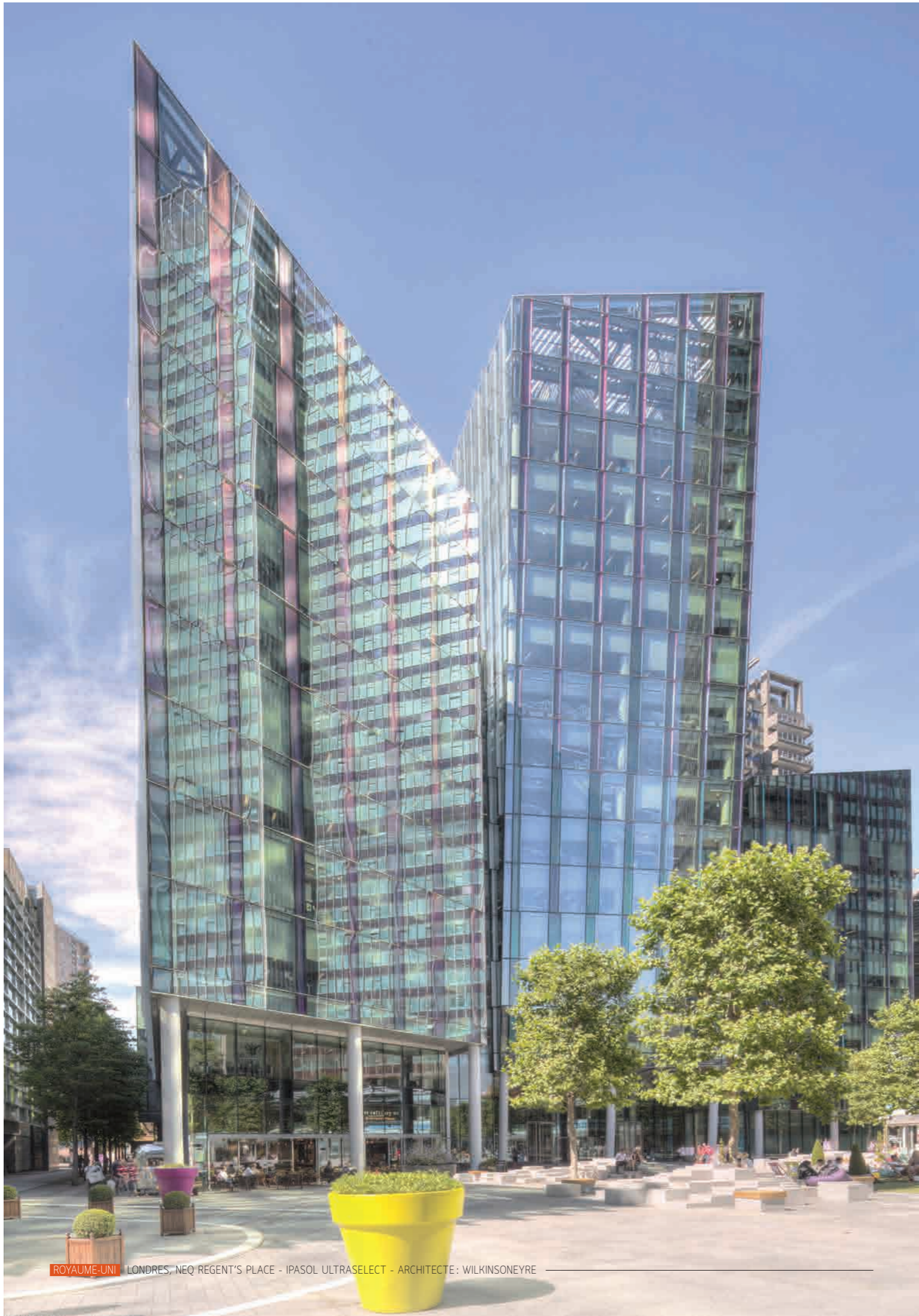
ROYAUME-UNI - LONDRES, NEQ REGENT'S PLACE - IPASOL ULTRASELECT - ARCHITECTE: WILKINSONEYRE