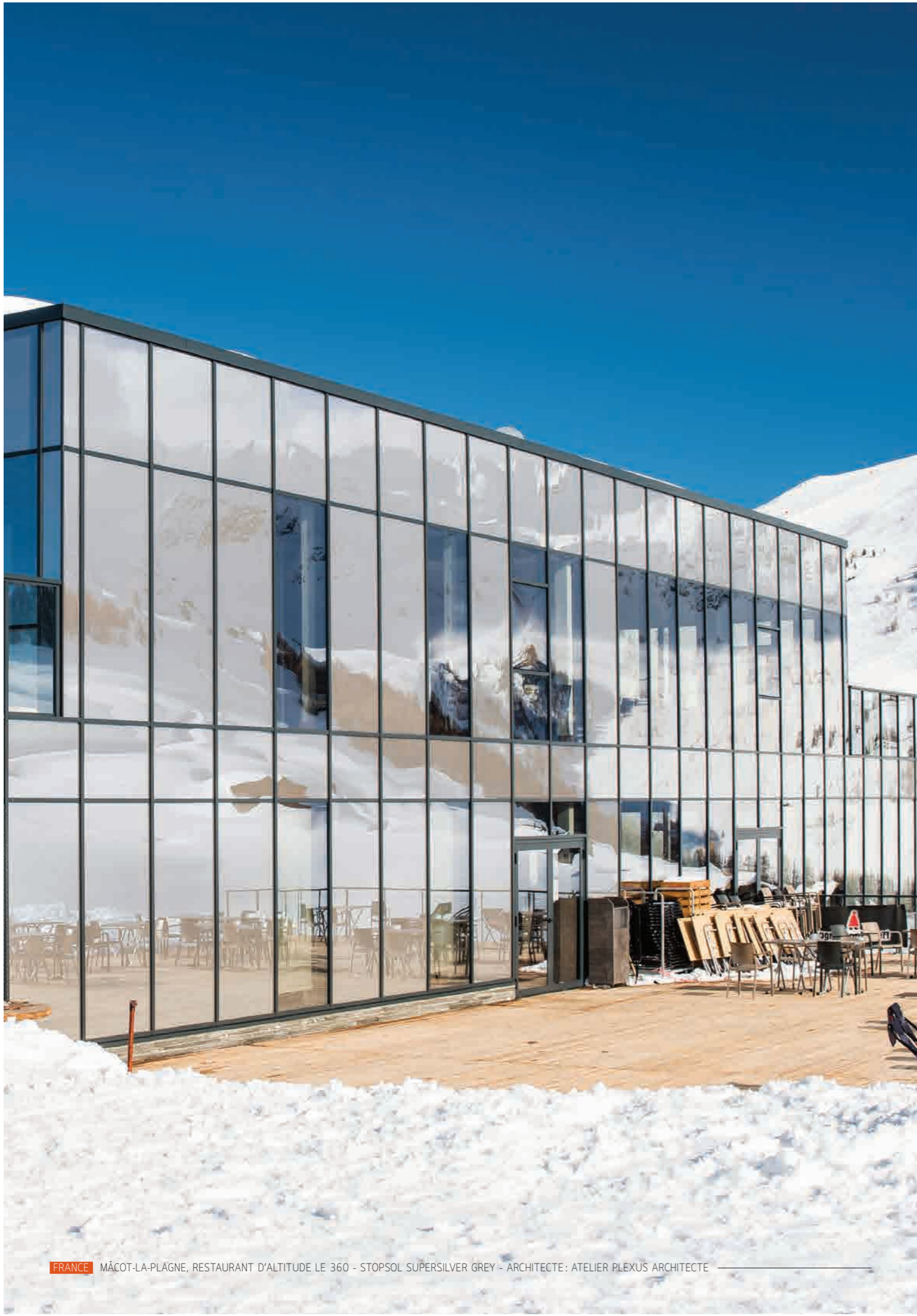
FRANCE MÂCOT-LA-PLAGNE, RESTAURANT D'ALTITUDE LE 360 - STOPSOL SUPERSILVER GREY - ARCHITECTE : ATELIER PLEXUS ARCHITECTE